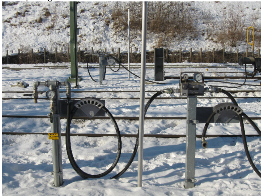
Bremsprobegerät PDR1-N KV-Terminal